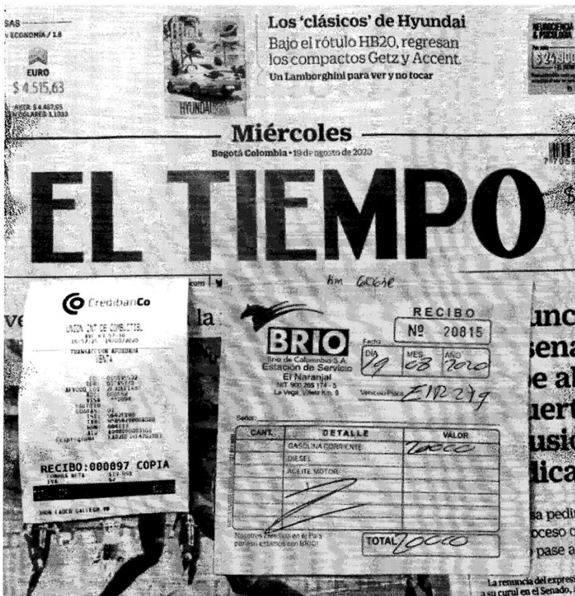
Fotografía aportada en escrito de denuncia.

Frente a este cargo, encuentra este despacho que el distribuidor minorista, para la fecha de los hechos tenía como bandera autorizada a Texaco, no obstante y como se evidenció en la denuncia presentada por Biomax y el informe presentado por la Policía Nacional, el cual reposa en el expediente digital, se logró establecer que para los meses de agosto y septiembre de 2020, la estación de servicio El Naranjal exhibía la marca comercial de Biomax en sus instalaciones, tal como se evidencia en las siguientes fotografías: