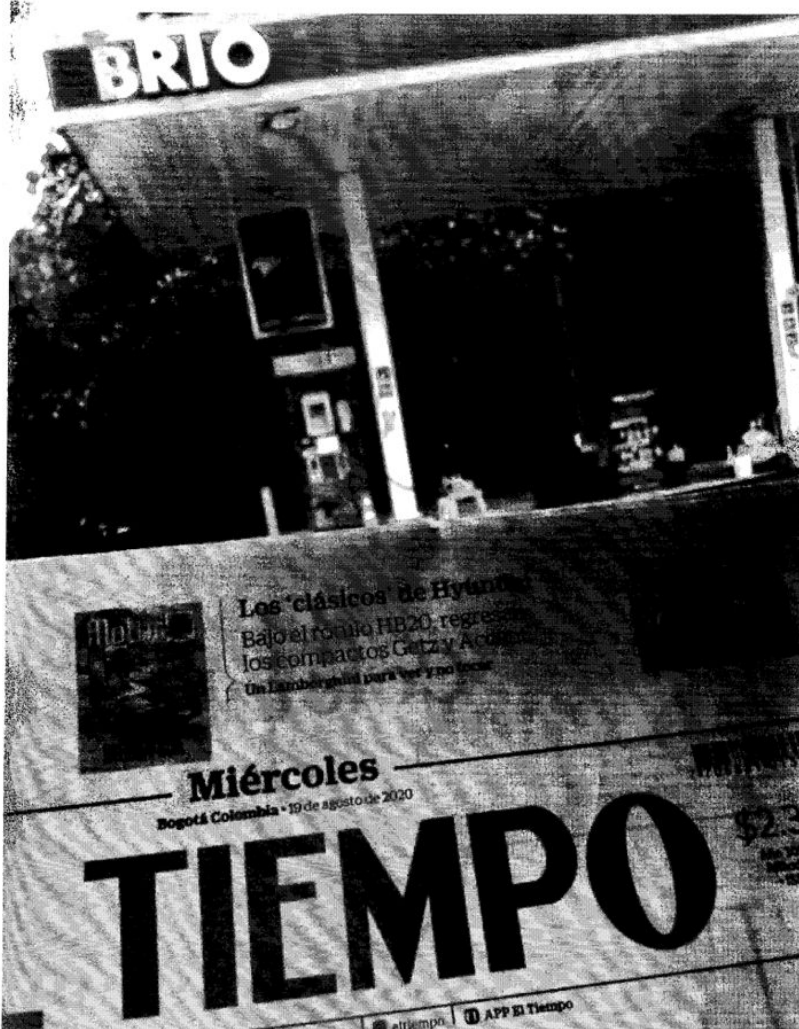
Fotografía aportada en escrito de denuncia.

En el mismo sentido, en el informe de policía No. S-2020-036820/SIJIN-DICAR-29.25, se refirió que el administrador de la estación de servicio manifestó que por el periodo de la pandemia generada por la Covid 19, no se habían realizado los trabajos para realizar el cambio de la marca exhibida, tal como se evidencia en el siguiente pantallazo extraído del informe: