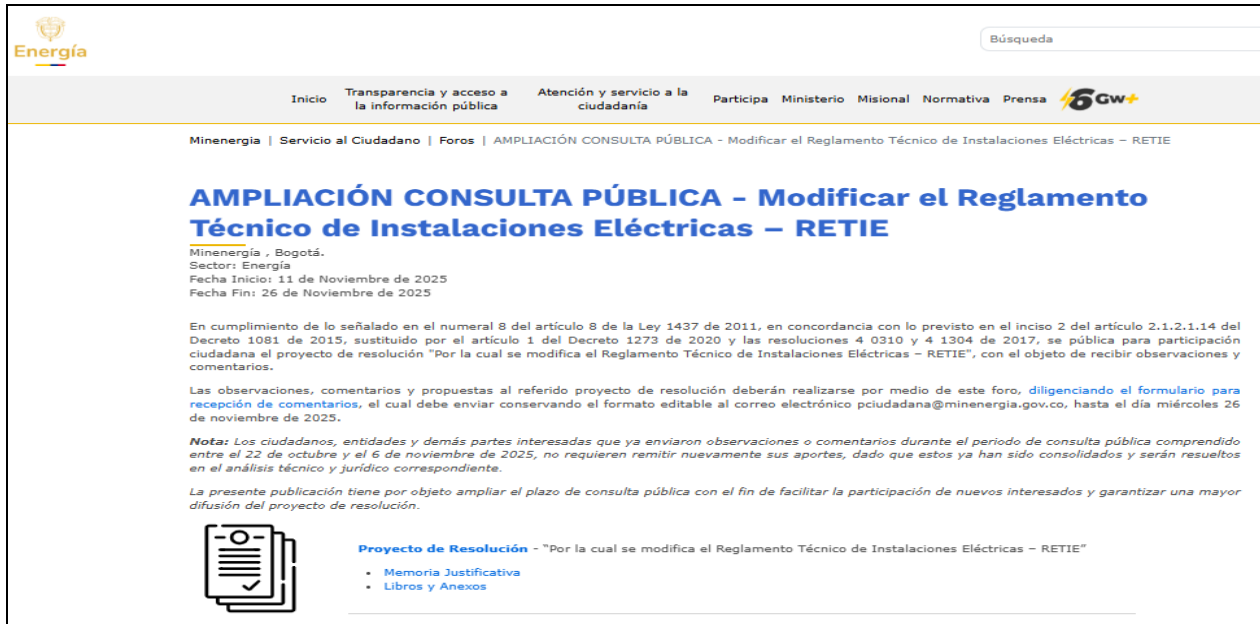
Ilustración 3 Divulgación: publicación en el espacio foros/ Portal Web MinEnergía