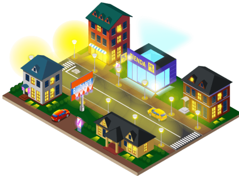
Figura 1.2.1.1. c. Contaminación lumínica.

Contaminación lumínica: Conjunto de todos los efectos adversos de la luz artificial que influyen en la atmósfera y que generan disminución de la percepción visual astronómica.