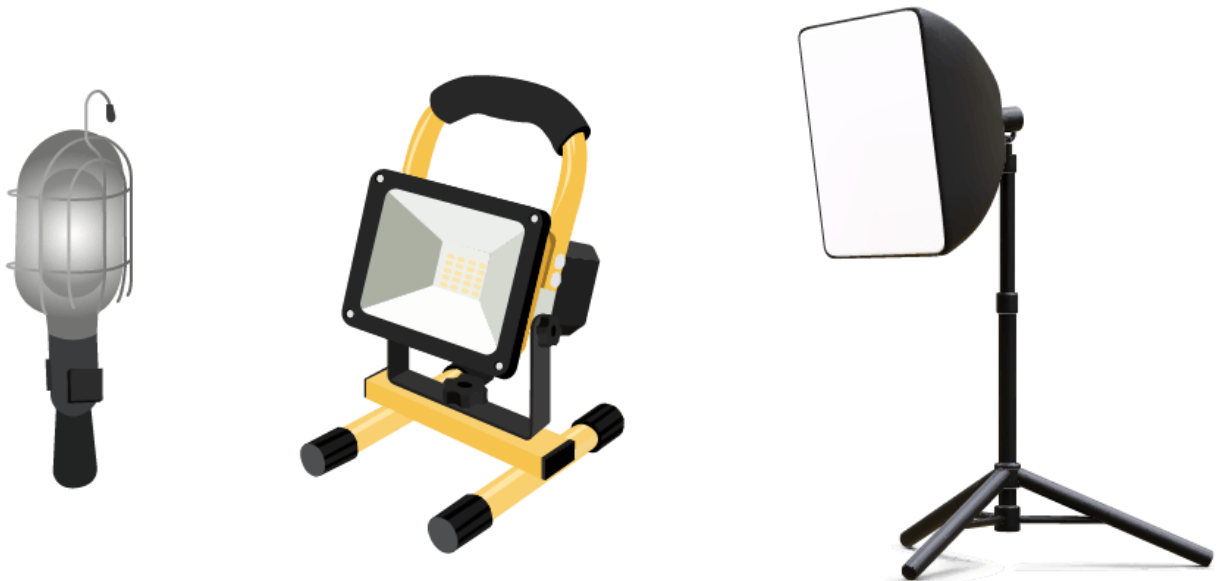
Figura 1.2.1.1. i. Ejemplos de luminaria portátil.

Por la cual se modifica el Reglamento Técnico de Iluminación y Alumbrado Público - RETILAP