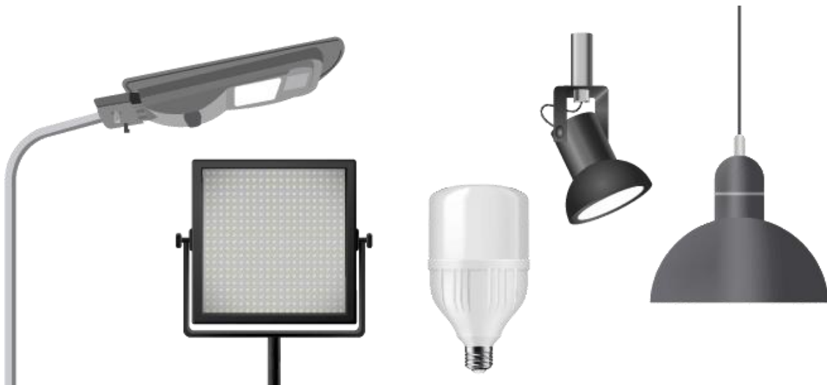
Figura 1.2.1.1. f. Ejemplos de luminarias.

Luminaria: Aparato que distribuye, filtra o transforma la luz transmitida desde al menos una fuente de radiación óptica y que incluye, excepto las propias fuentes, todas las partes necesarias para la fijación y protección de las fuentes y, cuando es necesario, los circuitos auxiliares junto con los medios para conectarlos a la fuente de alimentación.