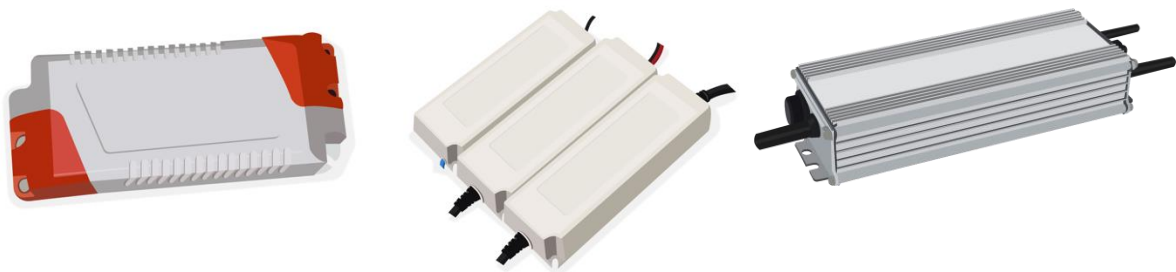
Figura 1.2.1.1. d. Ejemplos de drivers para fuentes luminosas LED.

Driver (Equipo de alimentación y/o control o Controlgear): Fuente de alimentación eléctrica o electrónica, o equipo de control LED ( controlgear for LED module; LED controlgear ), unido entre la alimentación eléctrica y uno o más módulos LED, que sirve para la alimentación de estos dispositivos a su tensión o corriente nominal y que puede consistir en una o más partes separadas. Puede incluir medios para la regulación de niveles de luz emitida, corrección del factor de potencia y la supresión de radio interferencias, además de otras funciones de control. El equipo puede consistir en una fuente de alimentación y en una unidad de control, o puede estar integrado total o parcialmente con el módulo o módulos LED.