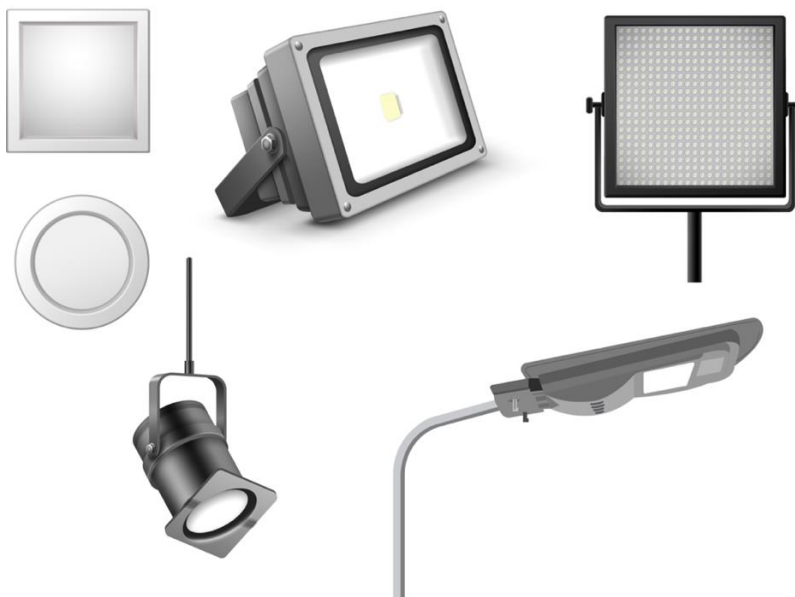
Figura 1.2.1.1. h. Ejemplos de luminarias LED.

Luminaria LED: Luminaria que incorpora una o más fuentes de luz LED.