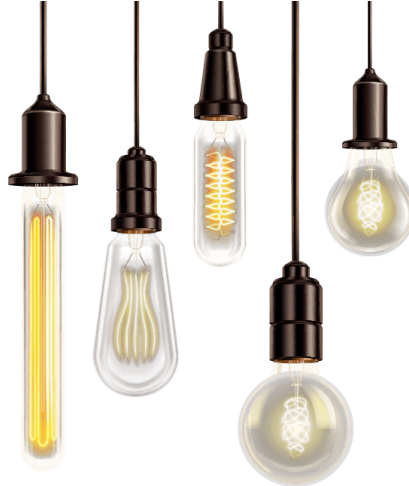
Figura 1.2.1.1. b. Ejemplos de bombillas de estado sólido decorativas.

Por la cual se modifica el Reglamento Técnico de Iluminación y Alumbrado Público - RETILAP