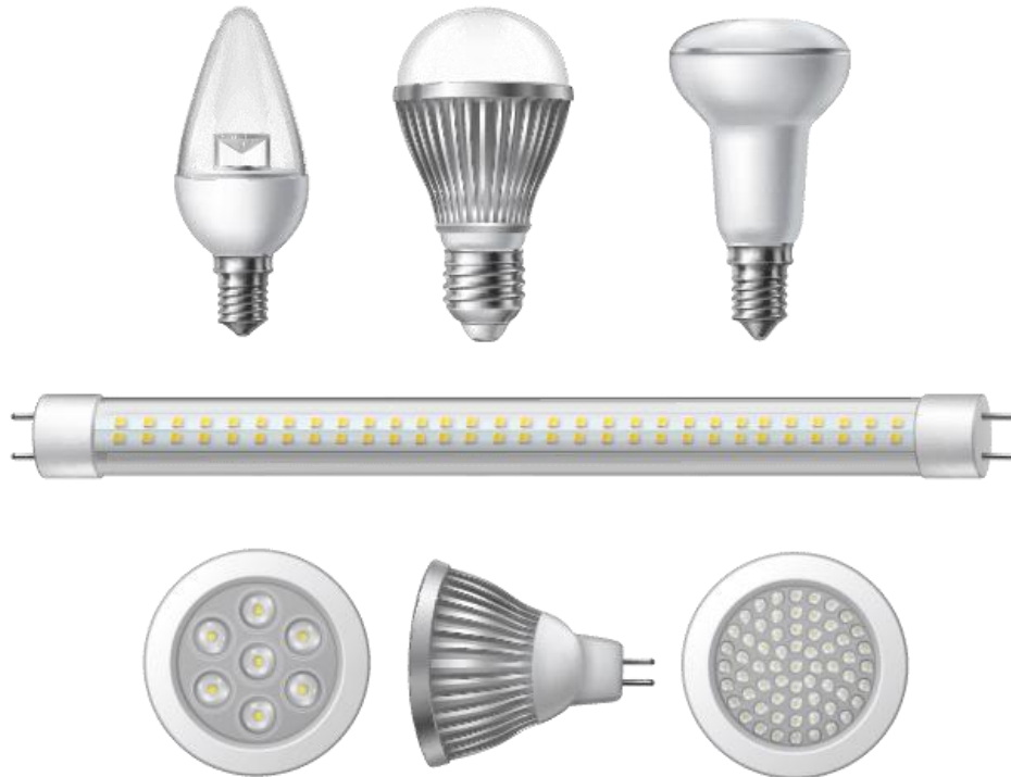
Figura 1.2.1.1. e. Ejemplos de fuente luminosa integrada LED.

Por la cual se modifica el Reglamento Técnico de Iluminación y Alumbrado Público - RETILAP