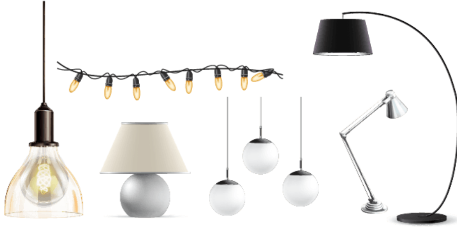
Figura 1.2.1.1. g. Ejemplo de luminaria decorativa.

Por la cual se modifica el Reglamento Técnico de Iluminación y Alumbrado Público - RETILAP