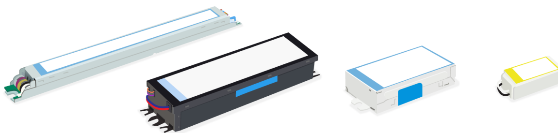
Figura 1.2.1.1. a. Ejemplos de balastos electrónicos.

Balasto electrónico: Dispositivo estabilizador destinado a la alimentación de una o varias bombillas. También puede ser construido para reemplazar balastos electromagnéticos en sistemas de descarga.