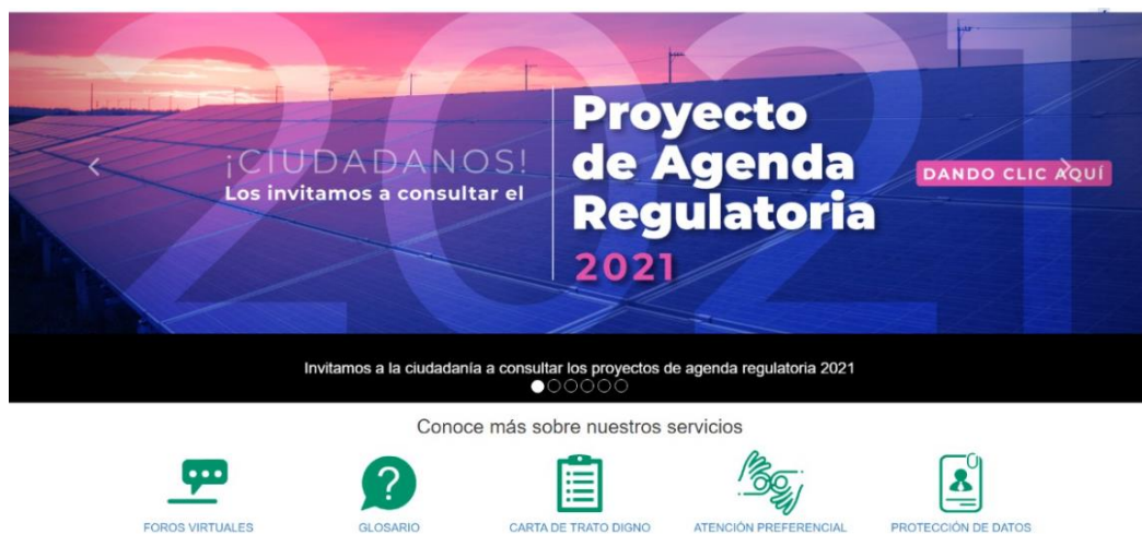
Ilustración 4 Divulgación: Home/ Servicio al ciudadano

En Minenergía todos los trámites son gratuitos.