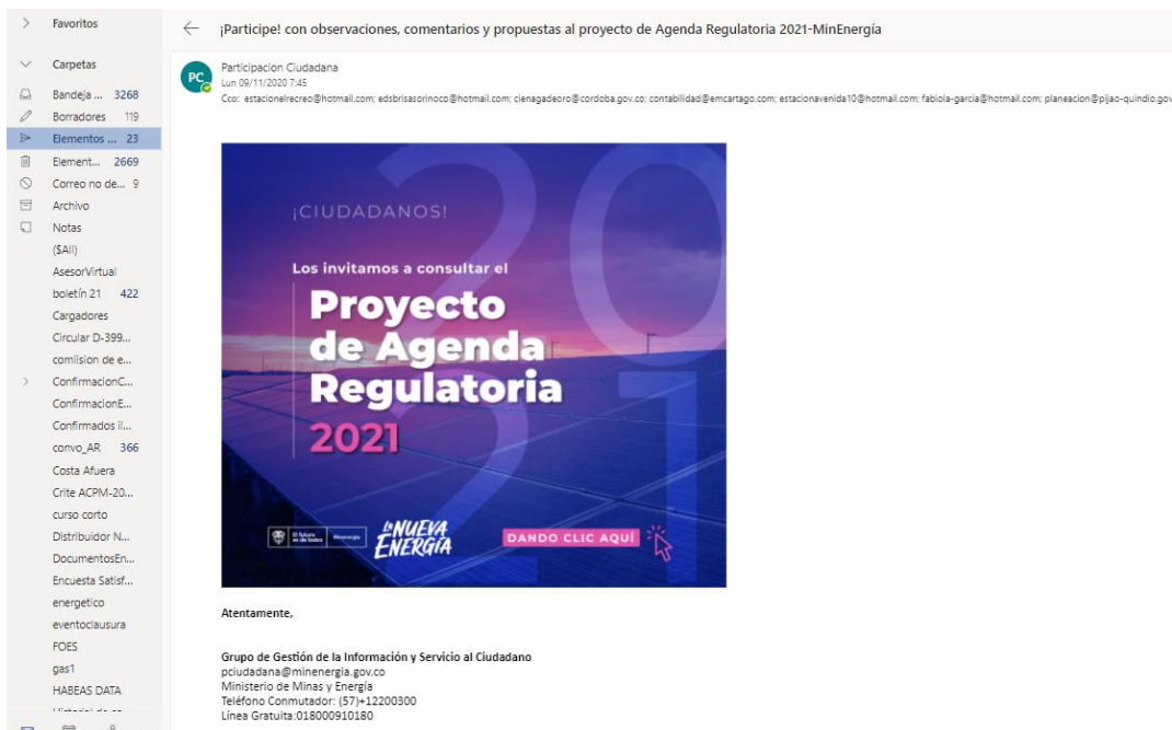
Ilustración 5 Divulgación: mensaje correo electrónico ciudadanos y grupos de valor