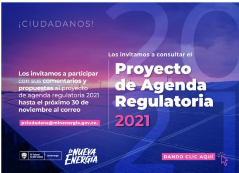
Ilustración 6 Divulgación: Vivo energía

En Minenergía todos los trámites son gratuitos.