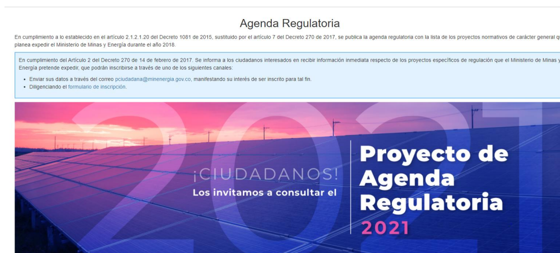
Ilustración 1 Divulgación: Ilustración 1 Divulgación: publicación en el espacio foros/ Portal Web MinEnergía

https://www.minenergia.gov.co/agenda-regulatoria