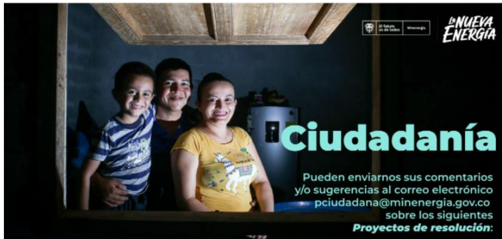
Ilustración 2 Divulgación: publicación en el espacio foros/ Portal Web MinEnergía

Proyecto de Resolución: Se reglamenta el artículo 49 de la Ley 2099 de 2021- Transición energética