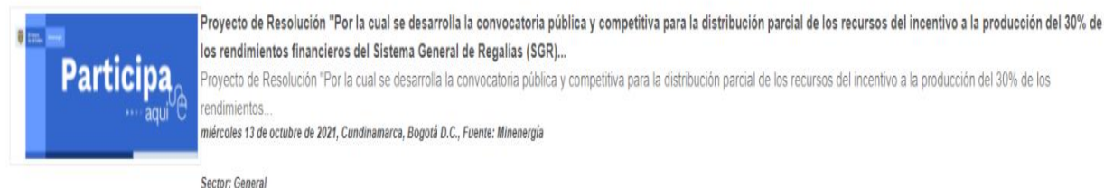
Ilustración 2 Divulgación: publicación en el espacio foros/ Portal Web MinEnergía

Ilustración 1 Divulgación: publicación en el espacio foros/ Portal Web MinEnergía