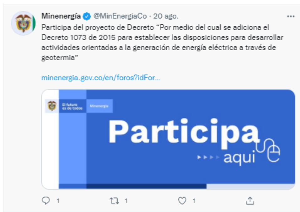
Ilustración 4

En Minenergía todos los trámites son gratuitos.