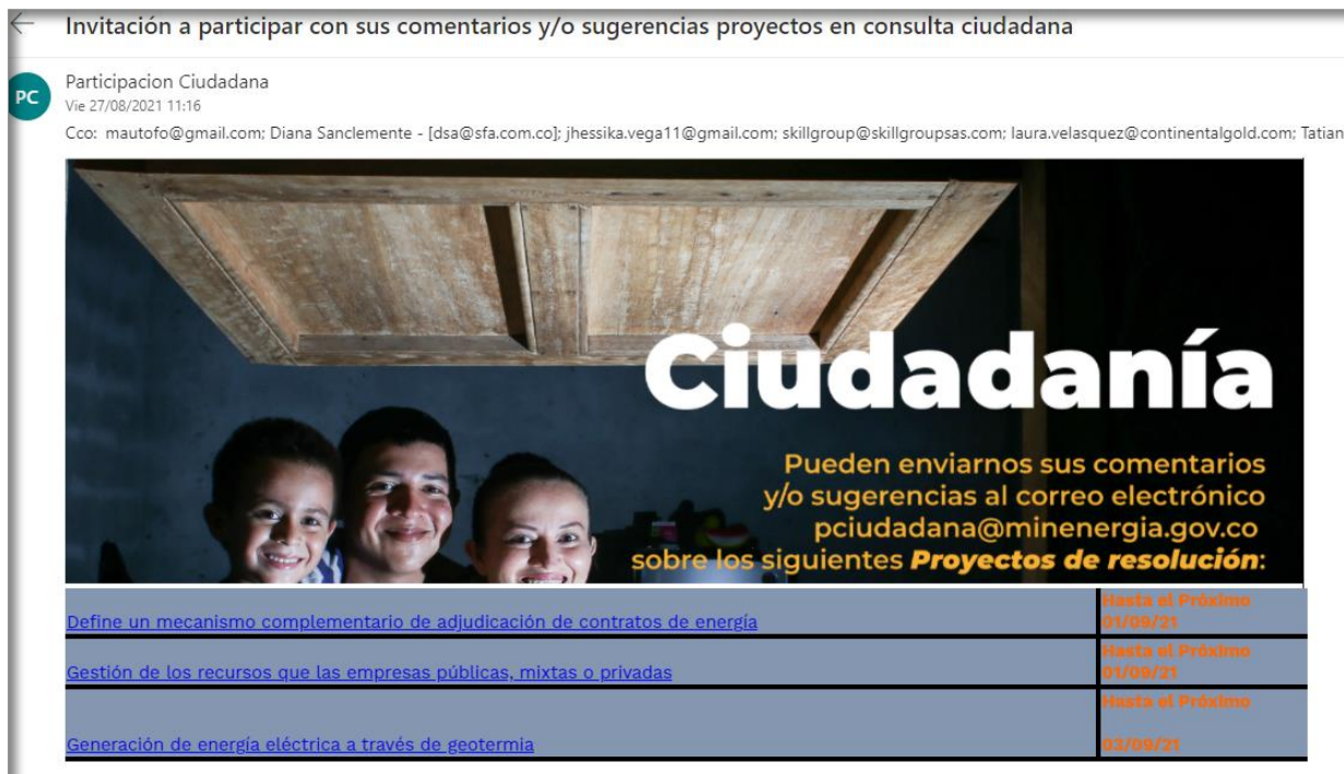
Ilustración 3 Divulgación: mensaje a correo electrónico de ciudadanos y grupos de valor/MinEnergía