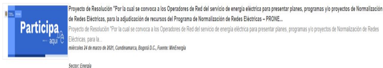
Ilustración 2 Divulgación: Home/ Otras Noticias

En Minenergía todos los trámites son gratuitos.