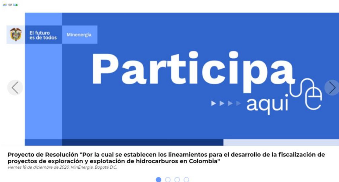
Ilustración 2 Divulgación: Home/ Otras Noticias