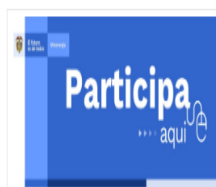
Ilustración 1 Divulgación: publicación en el espacio foros/ Portal Web MinEnergía

Proyecto de Resolución "Por la cual se actualiza el Reglamento para el Transporte Seguro de Materiales Radiactivos y se reglamenta la seguridad física en el transporte".