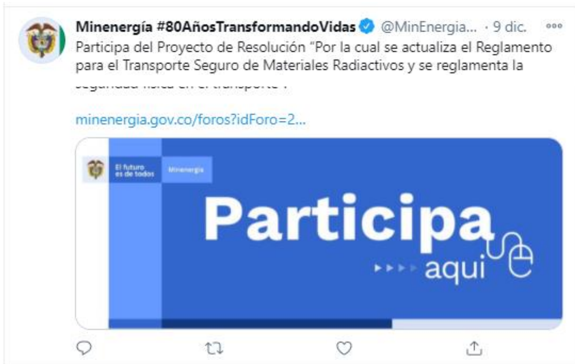
Ilustración 3 Divulgación: Redes Sociales