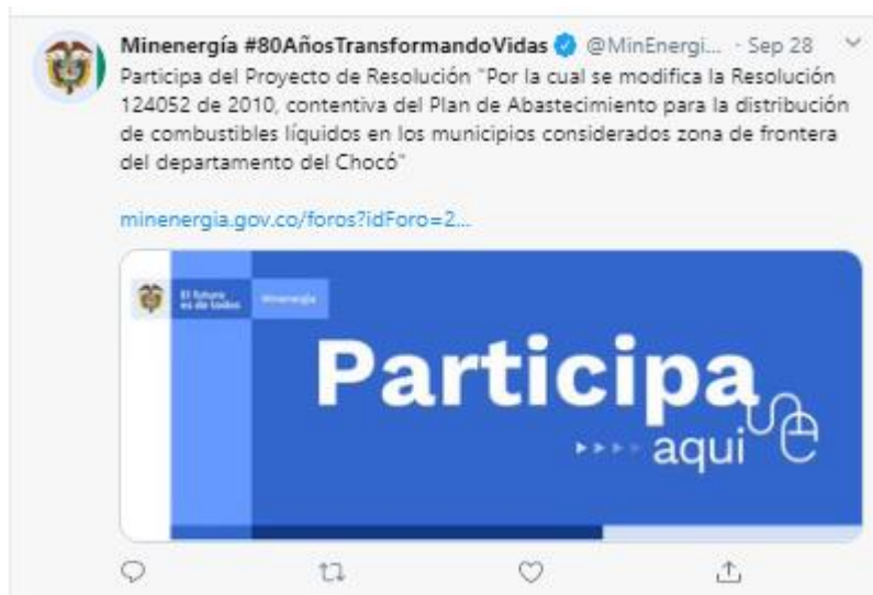
Ilustración 3 Divulgación: Redes Sociales