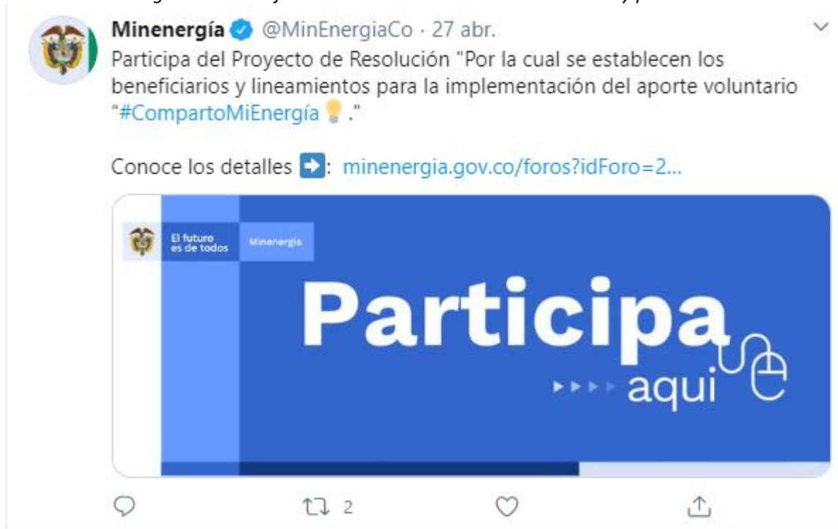
Ilustración 4

En Minenergía todos los trámites son gratuitos.