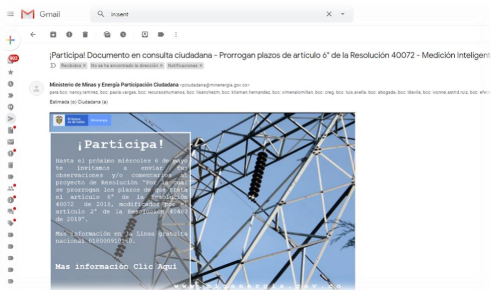
Ilustración 3 Divulgación: mensaje enviado correo electrónico ciudadanos y partes interesadas