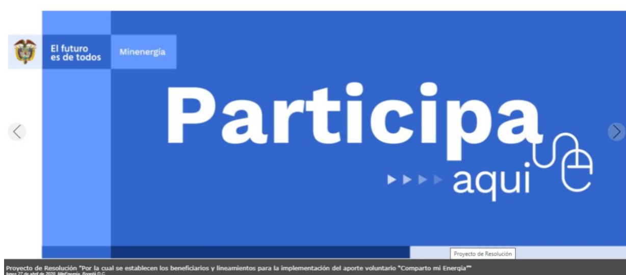
Ilustración 2 Divulgación: MinEnergía/home/Otras noticias

En Minenergía todos los trámites son gratuitos.