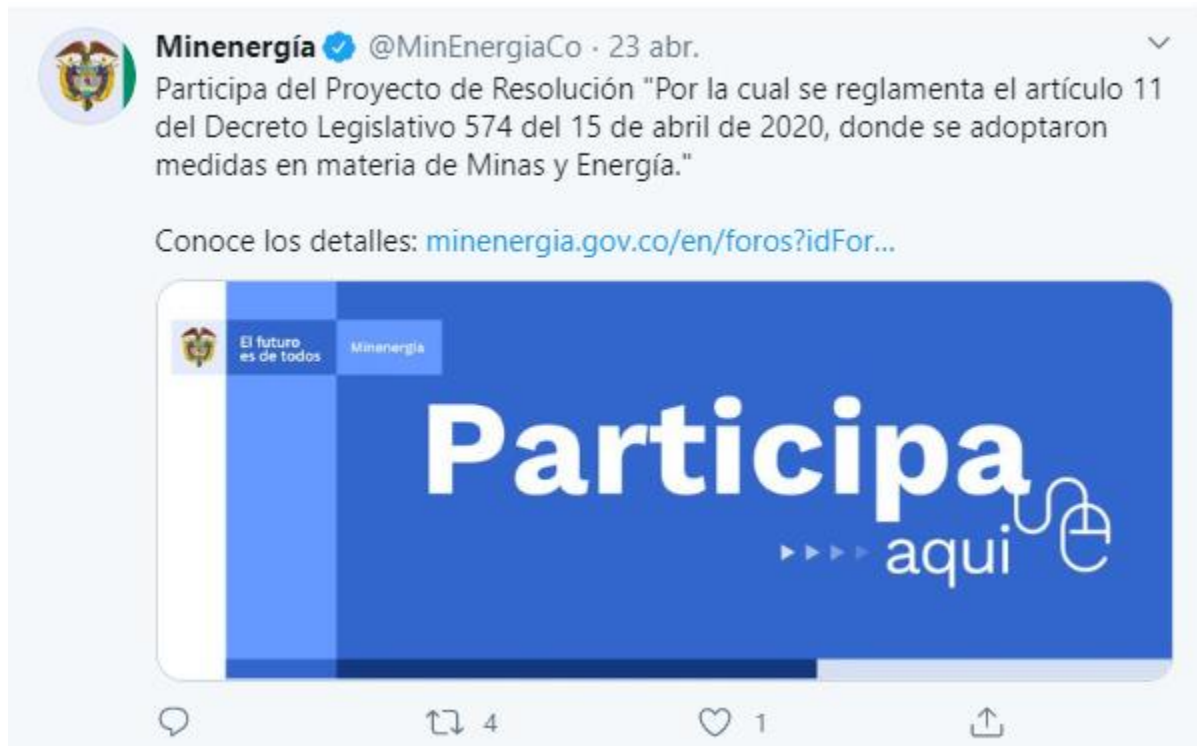
Ilustración 4 Divulgación: Redes Sociales