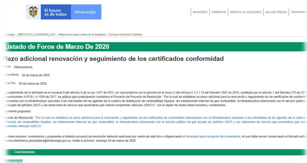
Ilustración 1 Divulgación: MinEnergía/Atención al Ciudadano/Foros/

https://www.minenergia.gov.co/foros?idForo=24186385&idLbl=Listado+de+Foros+de+Marzo+De+2020