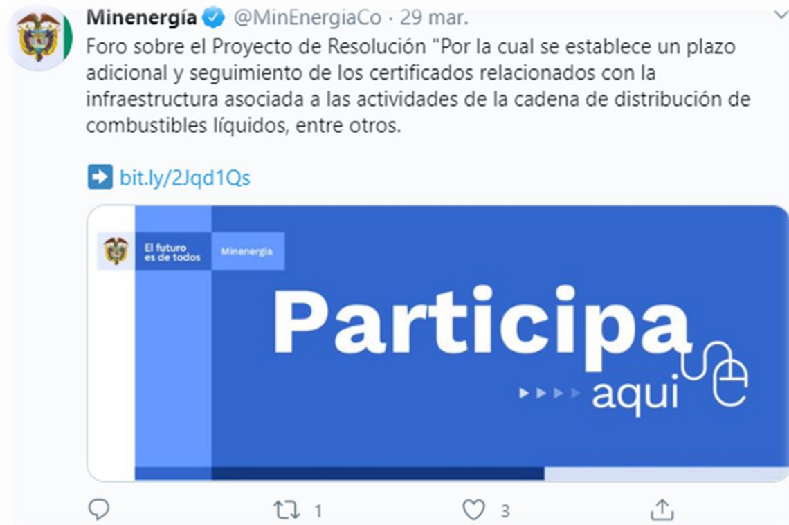
Ilustración 3 Divulgación: Redes Sociales