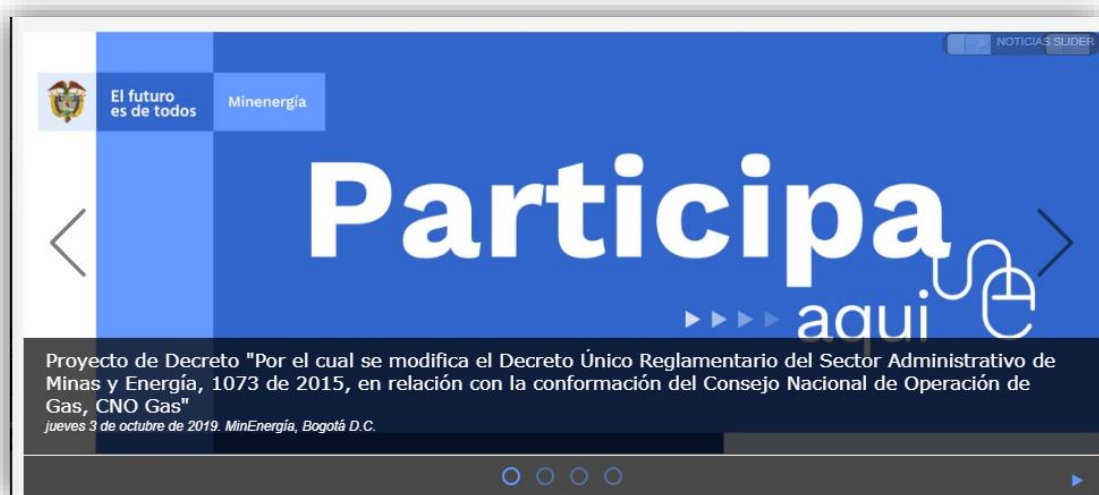
Ilustración 2 Divulgación: minenergia/home/Otras noticias