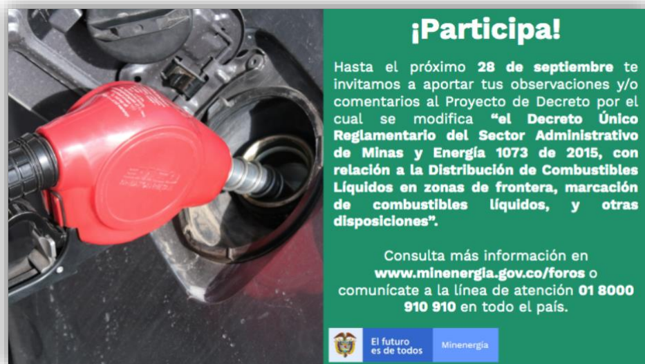
Ilustración 2 Divulgación: minenergia/mensaje al correo electrónico de ciudadanos y partes interesadas