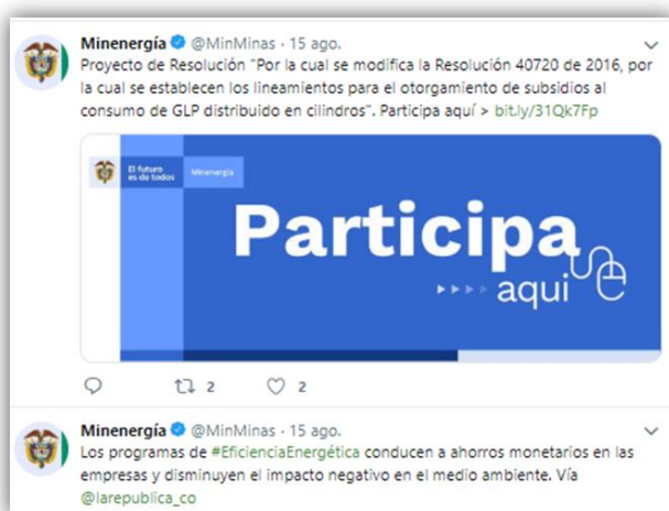
Ilustración 3 Divulgación: Redes Sociales