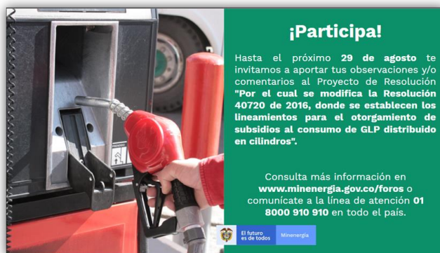
Ilustración 4: Correos electrónicos informando a los ciudadanos y partes interesadas