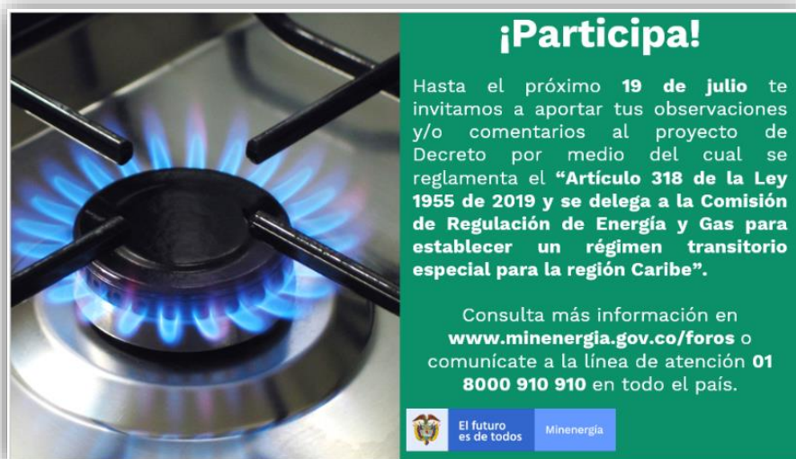
Ilustración 3 Divulgación: Correo electrónico a los ciudadanos