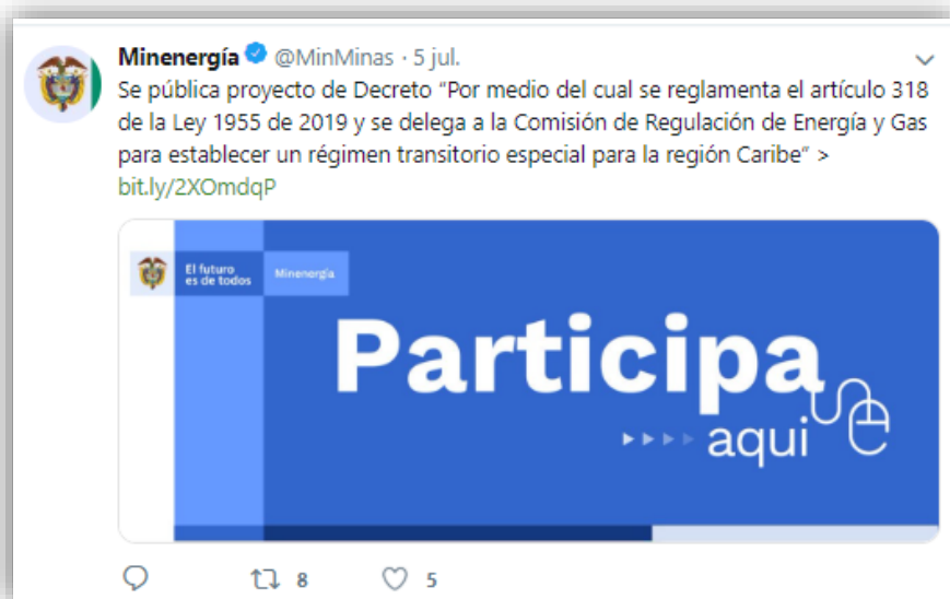
Ilustración 3