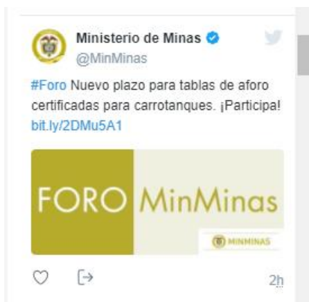
Ilustración 4: Divulgación en Redes sociales del Portal Web