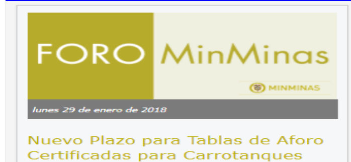
Ilustración 1: Divulgación en el Home del Portal Web

https://www.minminas.gov.co/foros?idForo=23968025&idLbI=Listado+de+Foros+de+Enero+De+2018