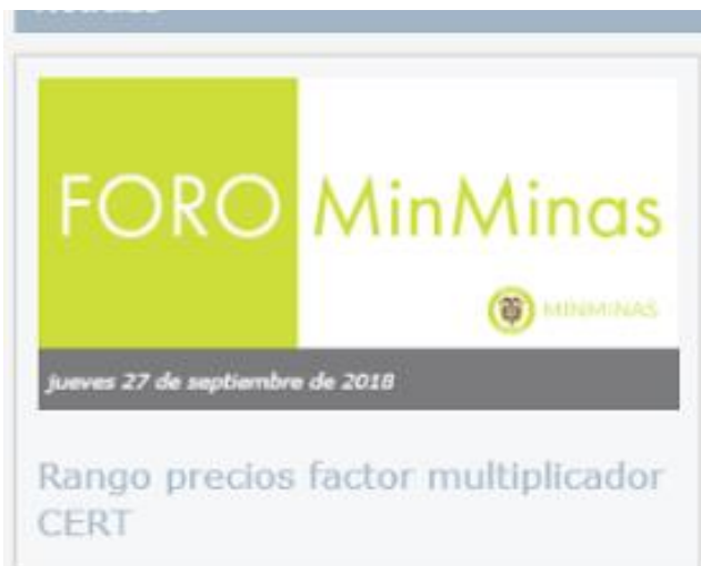
Ilustración 3 Divulgación: Aviso en Home/portal Web MME