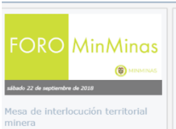
Ilustración 3 Divulgación: Aviso en Home/portal Web MME