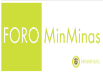
Ilustración 1 Divulgación: MinMinas/Atención al Ciudadano/Foros/