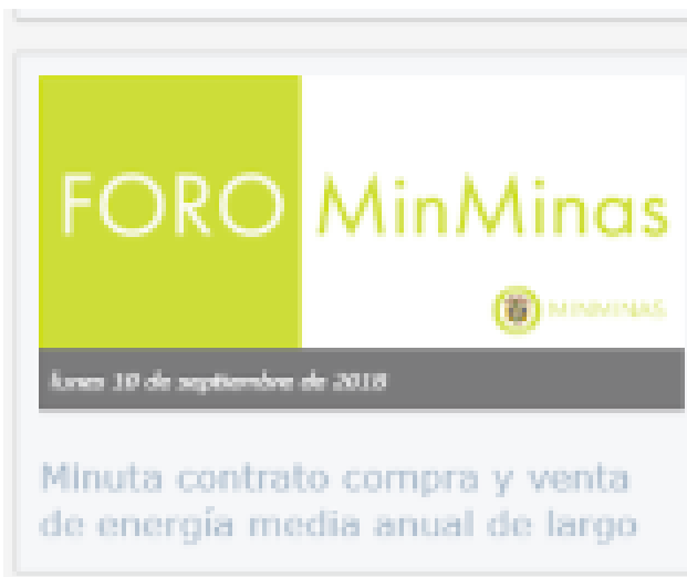
Ilustración 3 Divulgación: Aviso en Home/portal Web MME