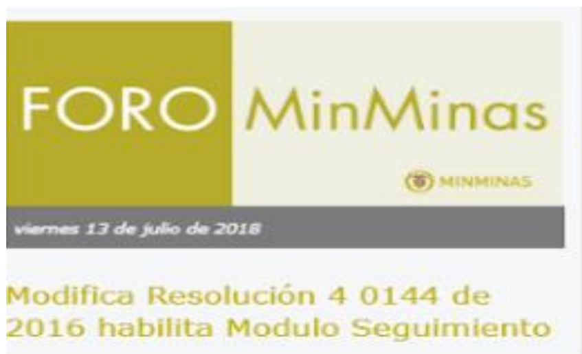
Ilustración 3 Divulgación: Aviso en Home/portal Web MME