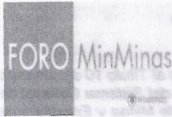
Ilustración 1 Publicación del Documento en Discusión

Compilación normas del Sistema General de Pensiones Decreto 1833 de 2017