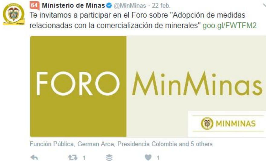
Ilustración 3 Divulgación en Redes sociales