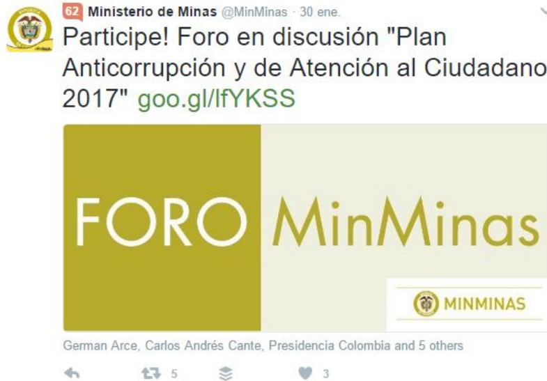
Ilustración 3 Divulgación en Redes sociales