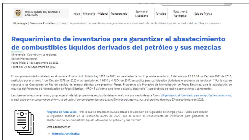
Ilustración 1 Divulgación: publicación en el espacio foros/ Portal Web MinEnergía

https://www.minenergia.gov.co/es/servicio-al-ciudadano/foros/requerimiento-de-inventarios-para-garantizar-el-abastecimiento-de-combustibles-liquidos-derivados-del-petroleo-y-sus-mezclas/